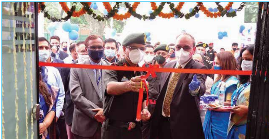
अध्यक्ष की उपस्थिति में नई शाखा का उद्घाटन

आपके बैंक ने भारतीय स्टेट बैंक के साथ गठजोड़ करने वाले कोलैटरल मैनेजर्स द्वारा जारी वेयरहाउस रसीदों के बदले प्रदान की गई प्रसंस्करण के लिए माल/निर्माताओं के व्यापारियों/मालिकों को वित्त प्रदान करने के लिए वेयरहाउस रसीद वित्तपोषण योजना (डब्ल्यूएचआर) शुरू की है। इसके अलावा, केंद्रीय भंडारण निगम (सीडब्ल्यूसी) और राज्य भंडारण निगम (एसडब्ल्यूसी) द्वारा जारी WHR भी WHR वित्त के लिए पात्र होगा। आपके बैंक ने डब्ल्यूएचआर वित्त पोषित के तहत एनपीए/स्ट्रेड खातों की ई-नीलामी के लिए ई-एनडब्ल्यूआर और एनईएमएल (एनसीडीईएक्स की सहायक कंपनी)